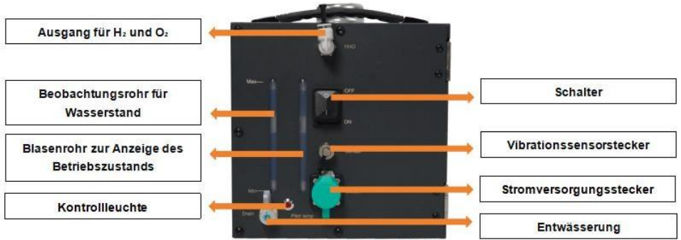
Apparence du système